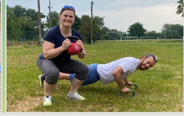
Begleitender Fitnesskurs für Eltern

Der Verein setzt sich zum Ziel, das Sportengagement im Alltag zu fördern, da auf diese Weise ein Verständnis für eine gesunde Lebensweise entwickelt wird. Bewegungsarmut im Zuge des digitalen Wandels sowohl in der Kindheit als auch im Berufsleben sind in diesem Zusammenhang ursächlich anzuführen.