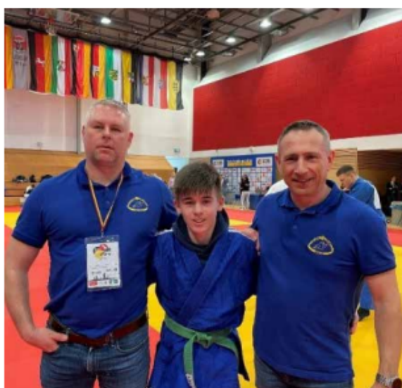
Deutsche Meisterschaften U18 in Leipzig